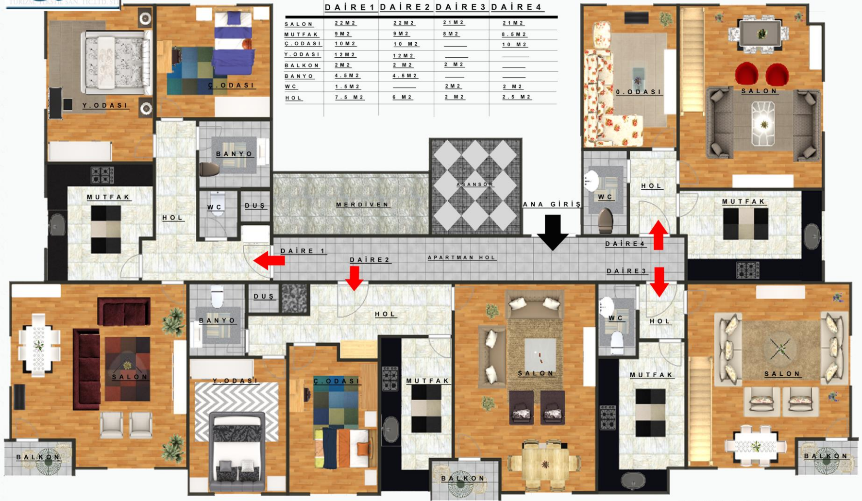
**ZEMİN KAT PLANI**